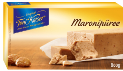
Maronipüree 800 g