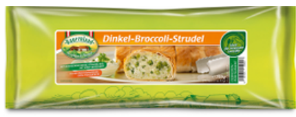
Dinkel-Broccoli-Strudel 750 g