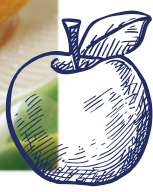
Apfelstrudel Blätterteig 1 kg