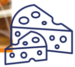
Karfiol-Käse-Laibchen 2 kg