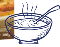
Kaspressknödel 300 g